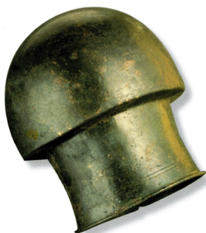
Ventouse en Bronze. voir note 1

Rappelons tout d'abord que l'utilisation des ventouses remonte à plusieurs milliers d'années. Nous pouvons en trouver la trace dans les écrits de plusieurs civilisations, comme sur des papyrus ainsi que sur des peintures et gravures greco-romaine. L'archéologie a également découvert quelques pièces, comme sur l'illustration ci-contre (ventouse en bronze trouvée à Martigny 1 ).